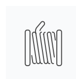
Tambur de Lemn